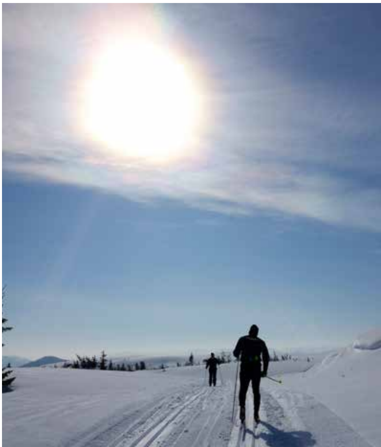
TOPP FORHOLD: Snø, ski, sol og suverene spor på snau fjellet. Hva mer kan en skiløper ønske seg?