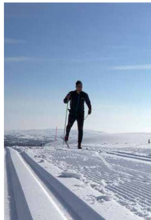
❶ BÅDE OG: Hvis det blåser på snaufjellet, kan du holde deg i den lunere skoggrensa. ❷ LANG UT: Løypene kjøres hver helg og hver dag i ferier og høytider.

– De har brøytet brøytetekantene. Det lover bra! Samboeren har nettopp erklært sin overbevisning om at Tuddal kanskje ikke var så dumt forslag. Det fredag etter en lang arbeidsuke, barnet er plassert hos overlykkelige besteforeldre og nå er det bare kilometere igjen til målet. Det er uhorvelige mengder med snø, selv er jeg i hundre.